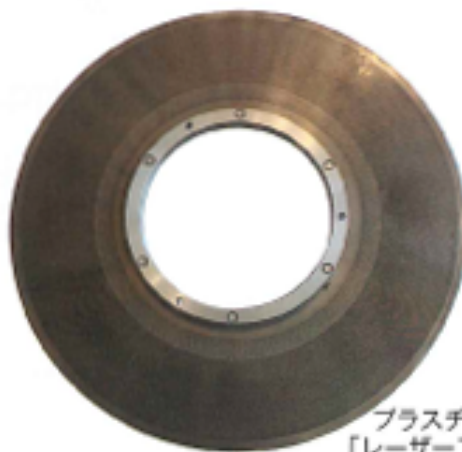
プラスチック再生用 「レーザーフィルター」

当社はさまざまな産業分野にて工業金網やパンチングメタルを活かした商品を開発・製造してきました。今後も研究開発を継続し、当社のノウハウを新分野・社会問題解決に役立てたいと考えています。