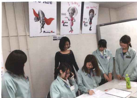
シンデレラ研修の様子

と世界をつなぐ奥谷ネットワークを世界市場で構築していきたい」と語る。同社が独自の技術で世界に羽ばたく姿は大きな注目を集めており、神戸市中学校の理科副読本に市内の中小企業ではただ1社取り上げられている。