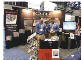
[Welftec 2015] (シカゴ) に参加

2013年にはシカゴ、2014年にはデュッセルドルフに事務所を開設しているほか、海外の展示会にも積極的に出展し高い評価をいただきました。2016年には欧米の同業メーカーと販売提携締結。海外にも販路拡大を推進しています。