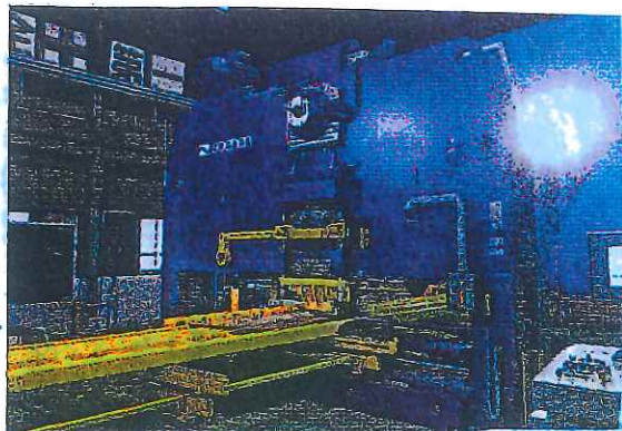
新たに導入した大型パンチングプレス機

明石第三工場には、sonei社(ベルギー)の大型パンチングプレス機「CAPS」を導入した。同設備は2億円以上で、奥谷社長は「国内では非常に珍しい設備。打抜き速度は従来の設備と比較すると3倍以上」と話す。同工場では板厚3mm以上の最大加工