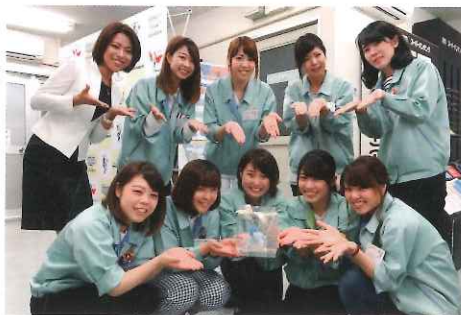
女子社員によるシンデレラ研修にて

孔の大きさや形状、材質によってさまざまなものを漉したり、篩い分けたりするのに使われる金網やパンチングメタルを製造しています。中でも2009年に商品化した「スーパーパンチング」は、金属の板厚より小さい直径の孔を開けることを可能にした世界初の技術。孔径を維持しながら板厚を上げることで強度が向上し、耐圧性、耐久性が要求される航空機分野のフィルターなどで広く採用されています。