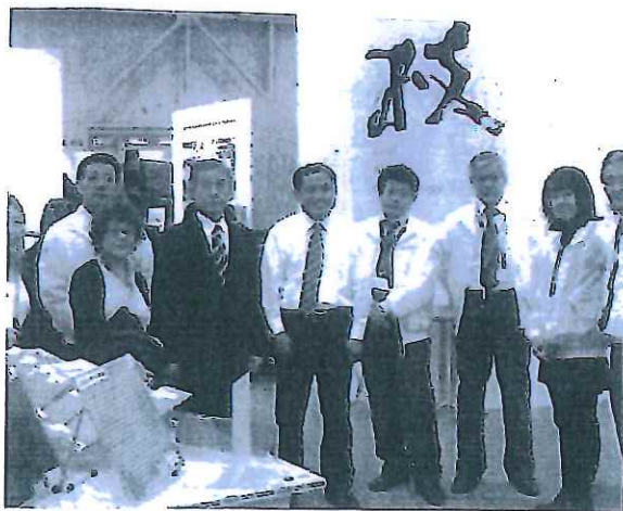
▲初の海外展示会、ハノーバーメッセ