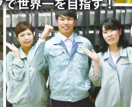
姫路営業所 若手スタッフ