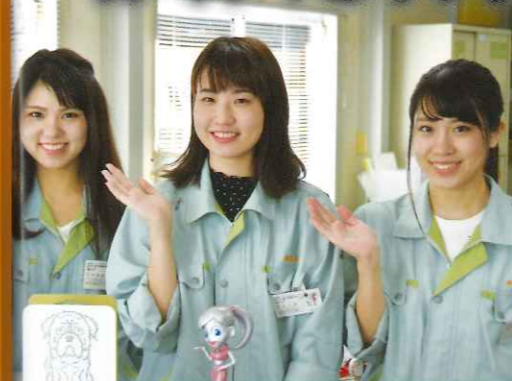
明石工場 管理センター 女性スタッフ