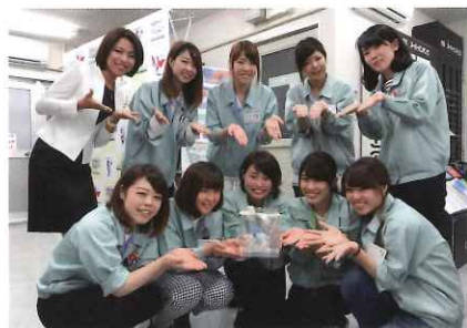
女子社員によるシンデレラ研修

120周年の節目となった2015年には「300年続く企業」をスローガンに掲げ、新入社員、中間管理職、幹部社員などステージ別に研修の充実を図りました。ユニークなところでは女子社員全員を対象にメイクアップ術や歩き方などを講義する「シンデレラ研修」も開いています。「自信を持って仕事に」との思いからです。創業来大切にしてきた「和を以て貴しとなす」の精神は今も貫かれ、社員旅行や出し物などで大いににぎわう社内イベントも多く開かれています。