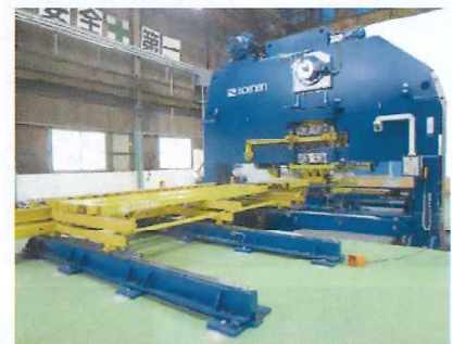
ベルギー/スーネン社製 高精度200tパンチングプレス機