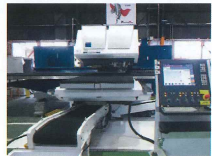
トルンプレーザー複合機