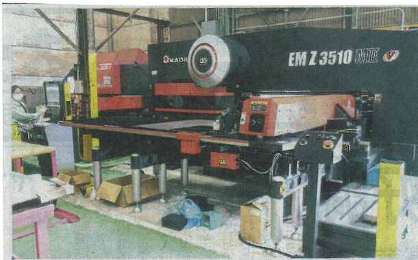
導入したタレットパンチングマシン

奥谷金網製作所は、明石第2工場にアマダ製のタレットパンチングマシンを導入、6月末から本格稼働を開始した。同工場の生産高は3年後をめどに現状比30%アップの月間2億5000万円を目指す。