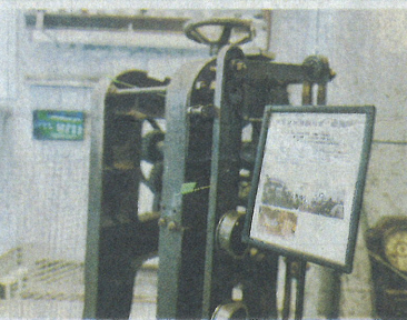
クリップ金網用ガリ線機械

り、ショールームの現在の製品群と相对比较できる。本社は1962年に竣工。レトロなつくりを生かしながら、昨年