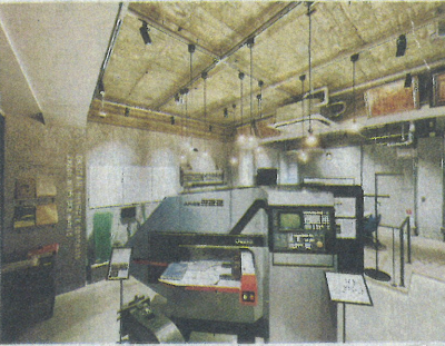
ミュージアム内部

奥谷金網製作所(本社)神戸市中央区、創業127年の過去、現在、それを未来を具現化した