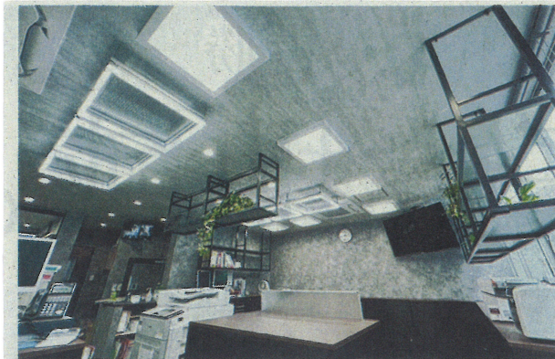
リニューアルした神戸本社管理部