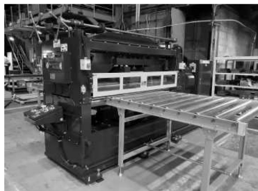
新たに導入したローラー

これに合わせて本社の総務部オフィスもレイアウトとイメージを変更した。女性社員の働きやすさを高めるのが狙いだ。23年度も理念に基づいた事業活動を数美に進めていく方針だ。(神戸市中央区)