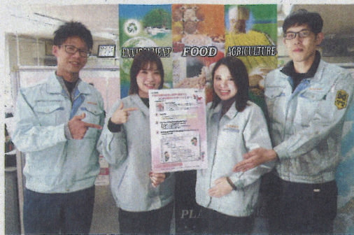
「パパママ宣言書」を持つ社員

サポートする(同社)としている。宣言書では目標として「男性の育児休業・出生時育児休暇取得率50%以上、平均2週間以上、女性の育児休業取得率100%以上」