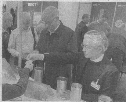
展示会に積極参加し、販路拡大につなげている(2月、ドイツ)

会社概要 1895年創業。工業用金網を手掛ける。「スーパーパンチング」と呼ぶ特殊なプレス加工技術に強みを持つ。2023年5月期の売上高は約13億円。従業員数は63人。