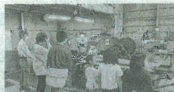
昨年11月、堺工場で実施した オープンファクトリー

「1. レアメタルの含有量が少 な、耐久性に優れ、地球環境 に配慮した商品だ。「長年持 続可能な開発目標(SDGs) に貢献できる商品を提供してき ていきたい」と意気込む。