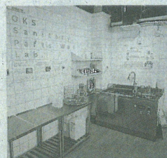
本社隣接地に開設した「OKSサンタリ」部品洗浄・ラボ

も80%削減できる。「昨年7月に展示会に出したところ、非常に反響が大きかった」と手応えを感じている。昨年11月には部品を持ち込ん